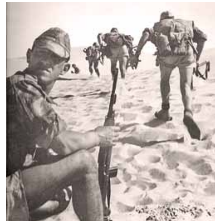
Grupo Selous Scout.

En ambos conflictos, naturalmente muchos cazadores profesionales se ofrecieron voluntarios para combatir por sus países. Poseían los conocimientos necesarios para moverse con soltura en el campo, sabían de armas, hablaban idiomas nativos