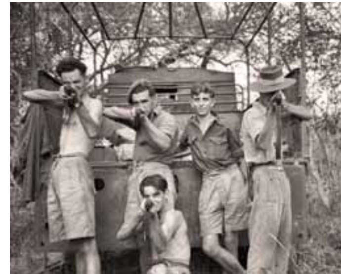
Patrulla durante la rebelión Mau Mau.

La lucha en Rhodesia se extendió de 1964 a 1979, y combatió a la guerrilla del ZIPRA y ZANU, que culminó con la creación de Zimbabwe y la entronización del dictador Robert Mugabe. En Sudáfrica, la guerra fue de 1966 a 1990 contra la guerrilla UNITA y SWAPO, que desembocó en la independencia de Namibia.