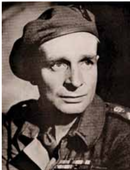
Laurence van der Post.