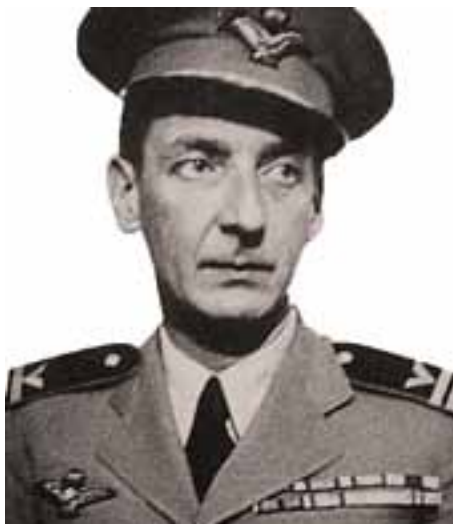
Laszlo de Almasy.